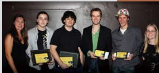
Les gagnants de l'édition 2010 des Vendredis animés, Concours de courts métrages.

Pour plus d'informations, visitez-nous au